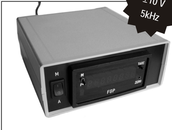
Die Abbildung zeigt das Gerät eingebaut in das optional erhältliche ABS-Gehäuse